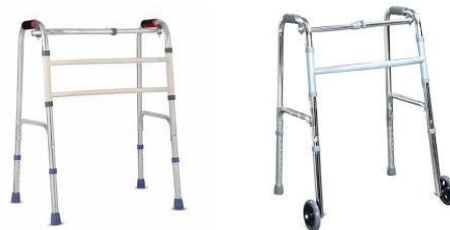
(a) Walker eksisting 1 (b) Walker eksisting 2

Gambar 5 merupakan jenis walker yang biasa digunakan oleh lansia di Indonesia. Oleh karena itu, kedua jenis walker tersebut digunakan sebagai pembandingan terhadap walker usulan dalam penelitian ini.