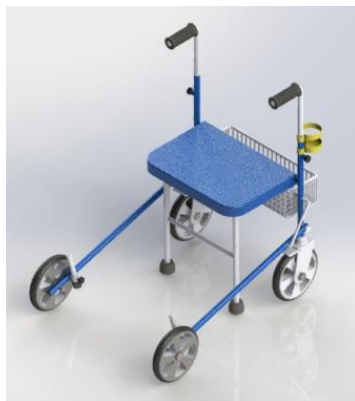
Gambar 4. Walker Usulan

Proses focus group discussion (FGD) ke-3, digunakan untuk mengevaluasi hasil rancangan walker usulan. Berdasarkan proses diskusi, gambar 4 merupakan hasil rancangan walker usulan yang disepakati bersama. Rancangan walker tersebut disepakati telah memenuhi syarat kebutuhan lansia yaitu easy to use , aman, multifungsi, portable dan awet.